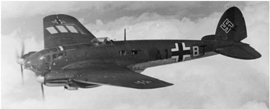
Heinkel He 111 bommenwerper